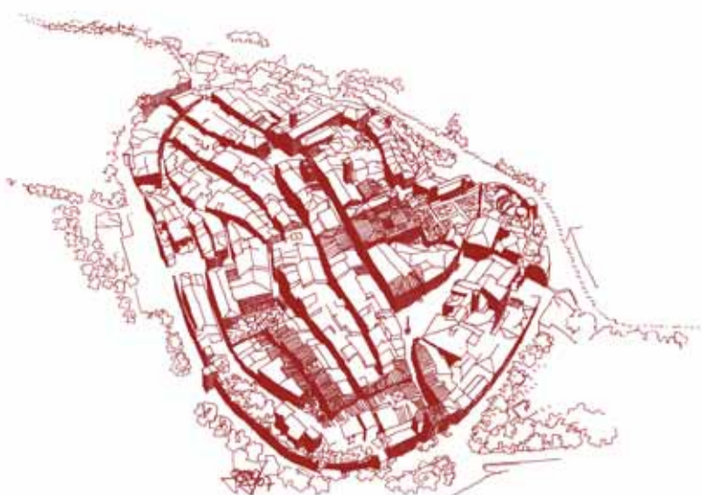
Monte San Savino