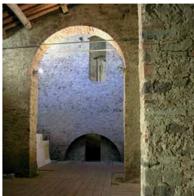
grafica sergio bianconcini